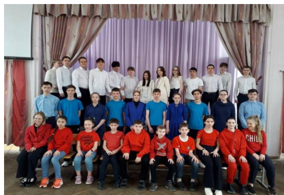
Проект «Олимпийский патруль»