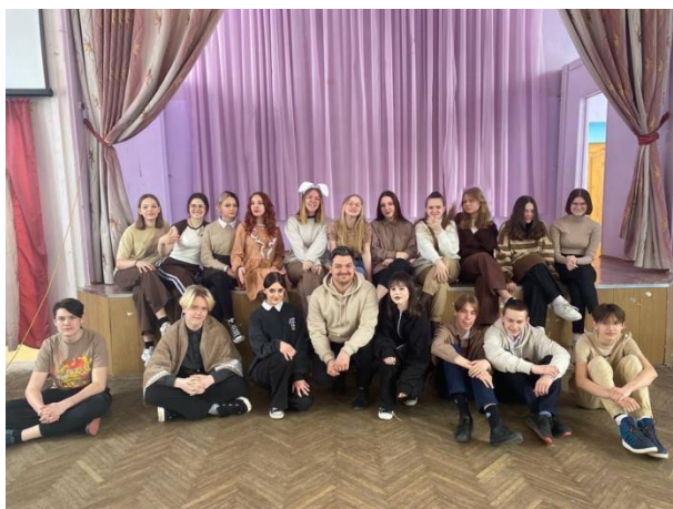
Проект «Живая книга»