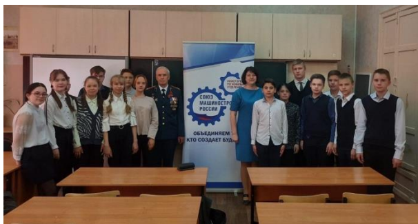
Проект «Диалог поколений»