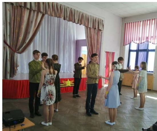
Проект «Мы внуки Победы»