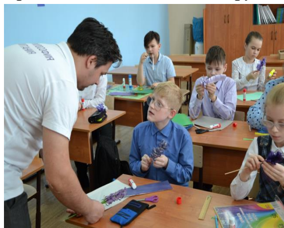
Акция «Крымская лаванда»