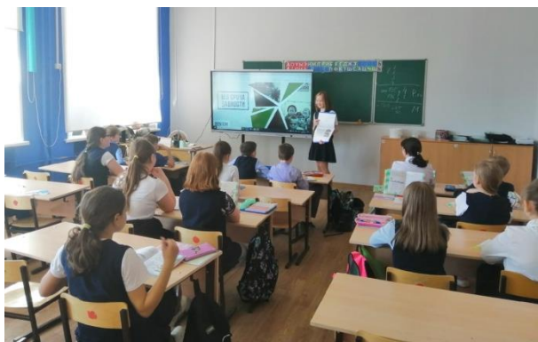
Проект «Говори правильно»