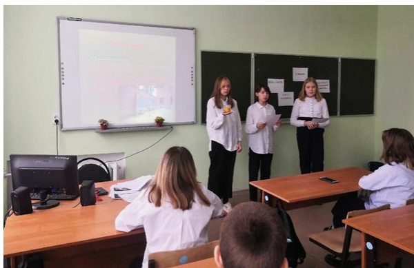
Акция «Свеча памяти»